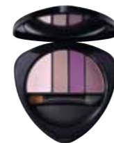
Eyeshadow Palette 01 Limited Edition