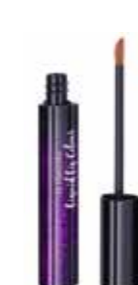
Liquid Lip Colour 01 Limited Edition