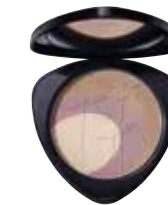
Teint Powder 01 Limited Edition